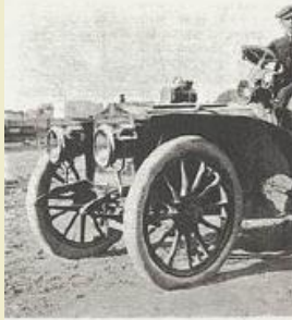
ING. DIATTO CON MACCHINA