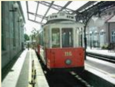
Straßenbahn Diatto aus dem Jahr 1911